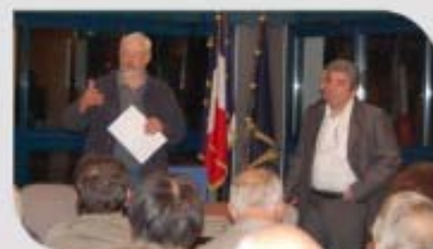
Rencontre avec les commerçants.