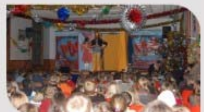
Le spectacle des Primaires.