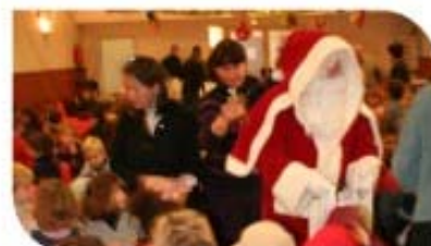
Spectacle pour les enfants de la maternelle le 12 décembre.