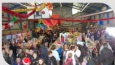
Marché de Noël le 7 décembre.