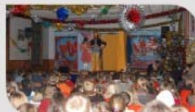
Le spectacle des Primaires.