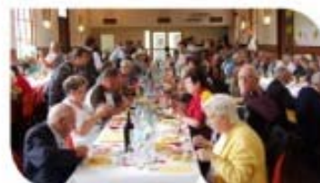
Repas Moules Frites.