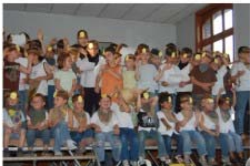
La fête du centre aéré de juillet.