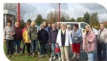
Départ de randonnée.