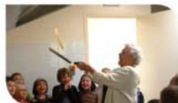
Après-midi crêpes à la maison de retraite.

Après un petit discours de bienvenue tous les convives ont pu profiter des plaisirs de la table, cuisinés pas "France Evènements". Aînés et Elus ont accordé leurs pas au rythme de la musique, interprétée par la joyeuse équipe "Sylviane et son Orchestre".