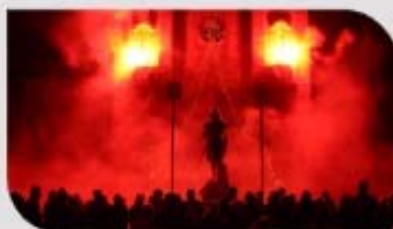
Embrasement de l'église.