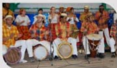
Marché de Noël le 7 décembre.