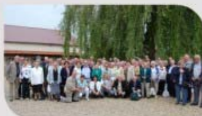
Le voyage des aînés.