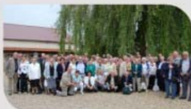
Le voyage des aînés.