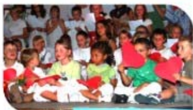
Fête du centre aéré le mercredi 27 août

Il sera mis en place début 2009: sensibilisation des enfants, rédaction du règlement, élections.