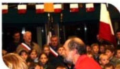
Les enfants des écoles le 10 novembre.