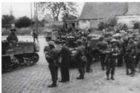
Célébration du 64ème anniversaire de la Libération de Pont à Marcq.