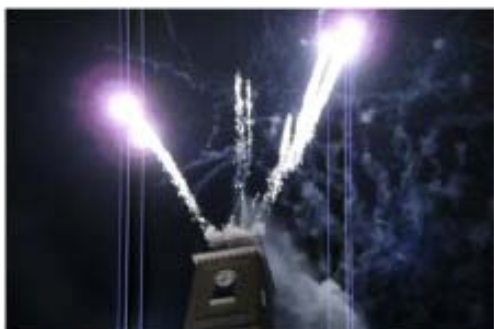
Week-end de Noël à Pont à Marcq.