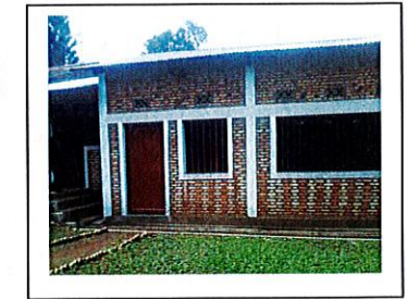
Photo en février 2019