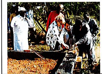
Première pierre en Juillet 2018